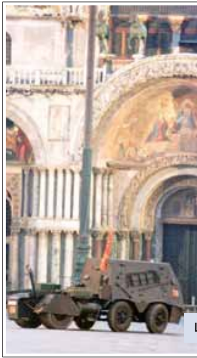
L'assalto dei Serenissimi a San Marco Ansa

stato straniero italiano occupante razzista e colonialista» a cui «non saranno garantite la sicurezza e l'incolumità personale». Per il resto ipotizzare il reato di associazione militare per un paio di pistole legittimamente possedute sembra eccessivo, ma si sa che la magistratura, appena sente odor di separatismo, sfodera il machete. Così verrebbe da dire agli amici veneti di provare a cambiar registro. Prestare il fianco ai giudici per essere imputati di reati ridicoli a causa di dichiarazioni fameticanti è poco saggio. Dopo i Serenissimi tocca ai Venetisti finire nelle grinfie dei magistrati con la conseguenza politica di un nulla di fatto e quella giudiziaria di qualche ipotetica condanna per lesa maestà allo stato italiano. In realtà, il vero problema è che, a prescindere dalle contumelie più o meno attendibili di questo o quel caporione, nella regione è presente un sentimento indipendentista. La visita a Mestre del Capo dello stato è stata assolutamente blindata: oltre allo staff di sicu-